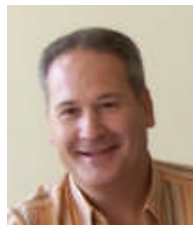
Conseiller Prud'homal Industrie ETAM