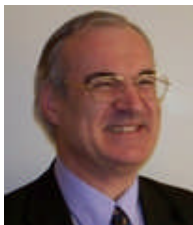
Conseiller Prud'homal Encadrement Administrateur de Caisse de Retraite