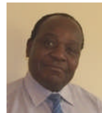
Conseiller préfectoral du salarié